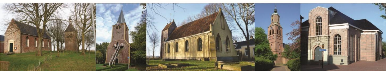
DEN ANDEL, WINSUM, WESTERNIELAND, EENRUM, WINSUM.

Maandag 17 maart, informatieavond Studiereis 'In het spoor van Luther en Bach'(10 t/m 16 juni 2025) Van 19.30-21.00 in het Willem Lodewijk Gymnasium in Groningen. Deze reis wordt georganiseerd door TVG-Groningen. Meer info via de link: Drietour | Duitsland | Maatwerkreis Duitsland Luther o.l.v. Dhr. B.L. van der Woude